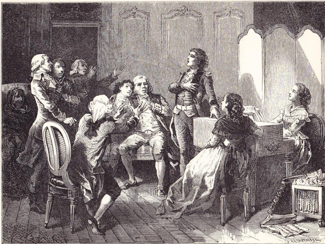
Origine de la Marseillaise (1792).